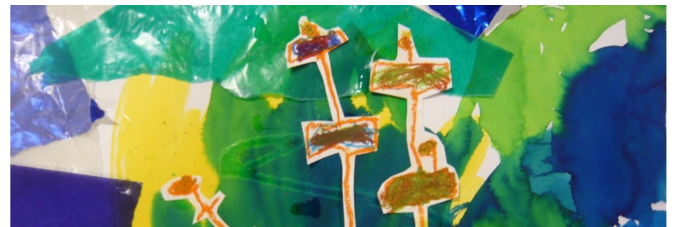
Werk van een 6-jarig kind vanuit de procesgerichte aanpak